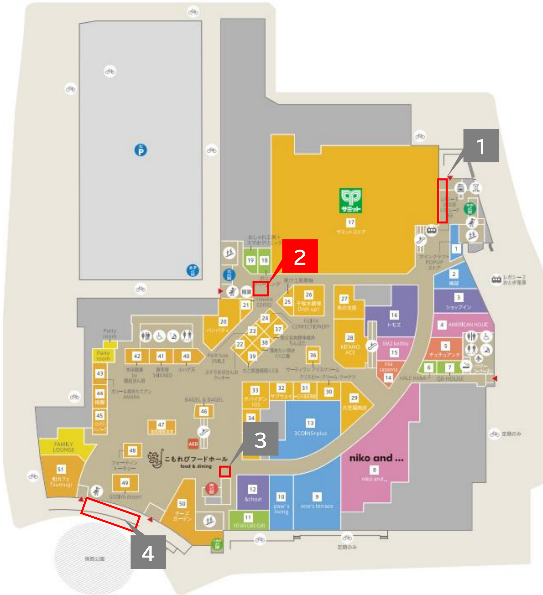
2 1F 北エレベーター前