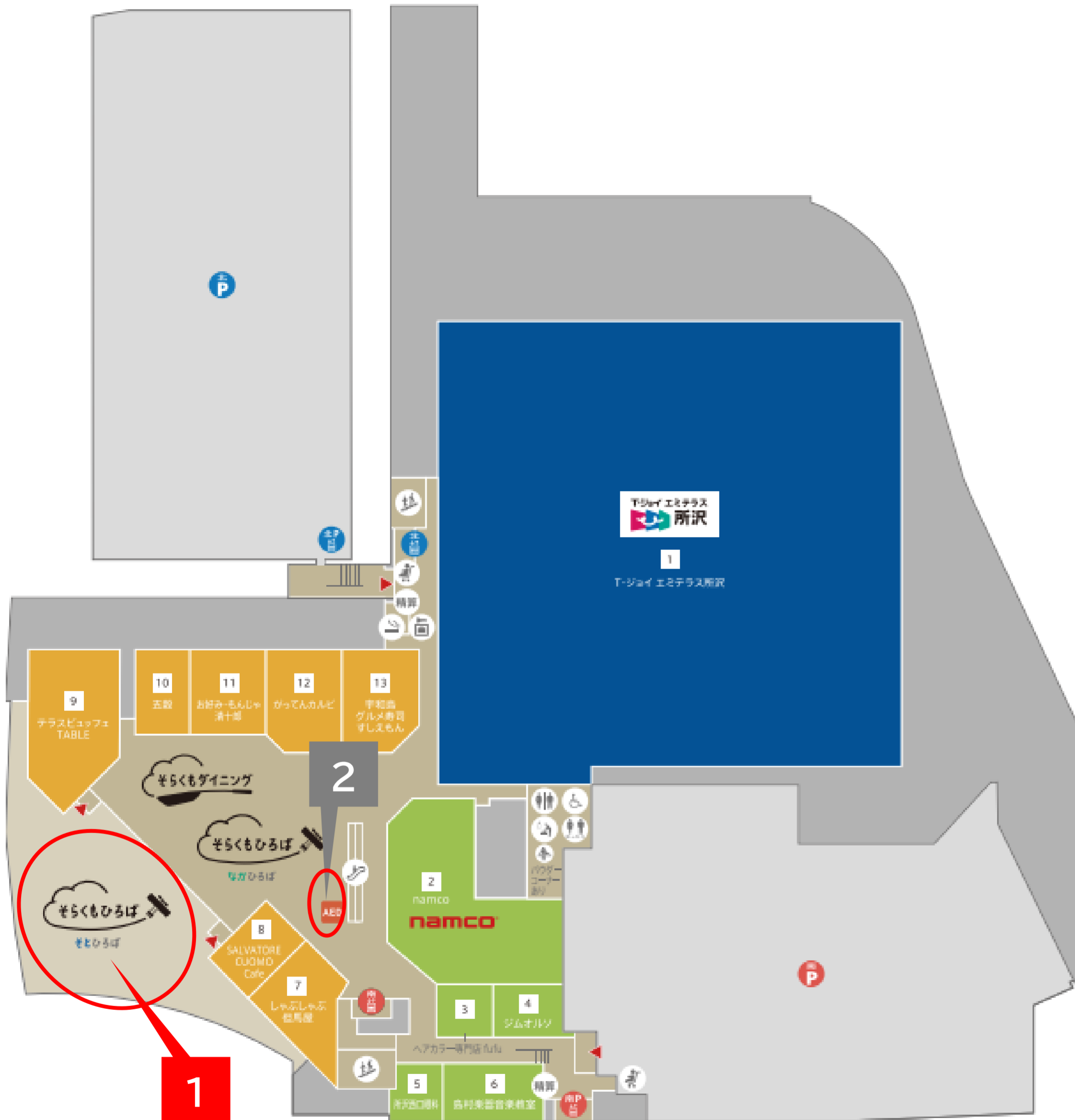
1 4F そらくもひろば/そとひろば