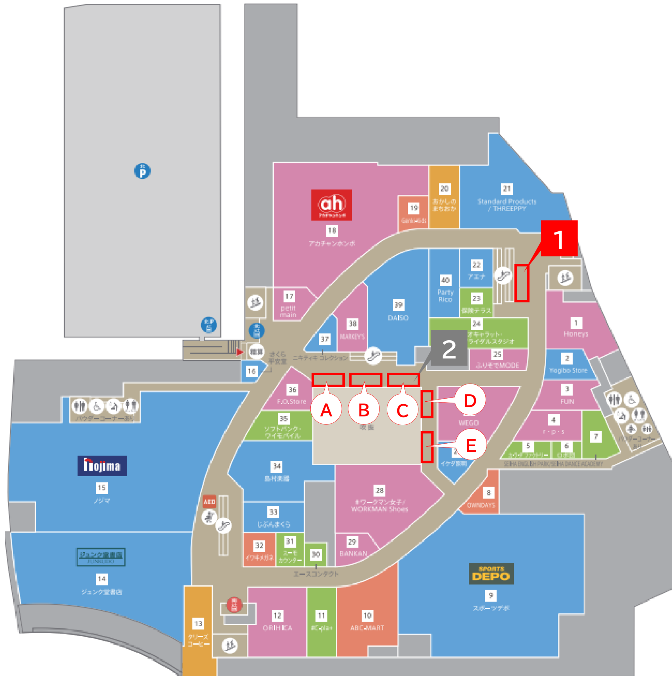
1 3F 北東エスカレーター横